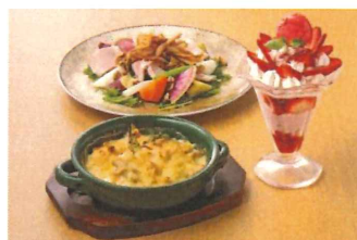
ヤシオポークと根菜の温サラダ (左上) いっこく野州鶏と湯波の 和風マカロニグラタン (左下) 贅沢いちごパフェ (右)