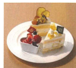
いちごのチーズケーキ (左下) 宮ゆずとオレンジのショートケーキ (右下) さつまいも好きが考える理想のケーキ (中央)